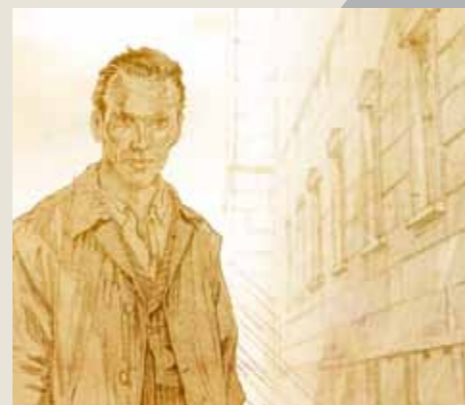
Karski w Londynie

dokumentalne. Poprzez fakt, że wyemigrowałem do Stanów z kraju tak innego, jakim jest Polska, posiadam w sobie ogromną ciekawość tego kraju i różną od urodzonych tutaj Amerykanów, perspektywę na ludzi i ich życie. Jan Karski stał się Amerykaninem, mimo ciężkiego akcentu, którego nigdy się nie pozbył. To nie sprawa paszportu, ale sprawa przemyśleń, obserwacji, odkrycia i otwartości na życie ludzkie. To właśnie Karski był łącznikiem dwóch kontynentów w sprawie żydowskiej. Ja mu do stóp w tej sprawie nie sięgam. Jeżeli poprzez moje filmy o tematyce żydowskiej doprowadzam do dyskusji i powoduję, że ludzie czegoś się dowiadują, może nawet zmieniają się – to wspaniale, cieszę się z tego. W końcu żyjemy po to, żeby zostawić po sobie wartościowy ślad, ja staram się robić to poprzez filmy.