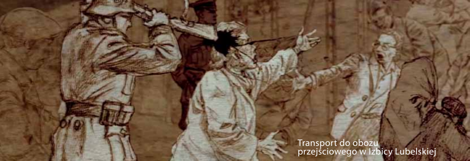
Transport do obozu przejściowego w Izbicy Lubelskiej