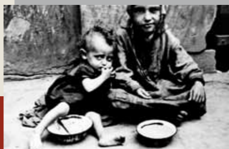
Dzieci w warszawskim getcie