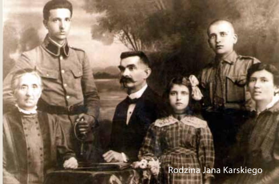
Rodzina Jana Karskiego