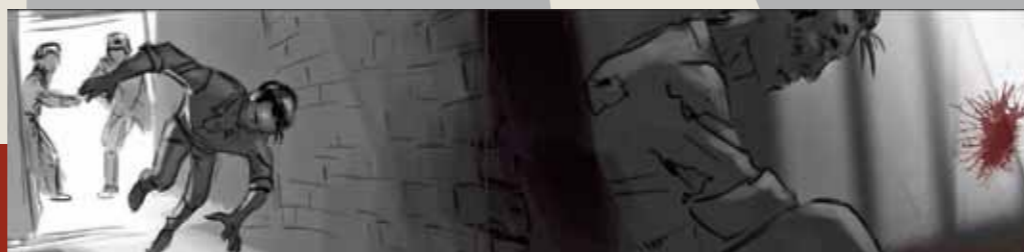
W więziennej celi