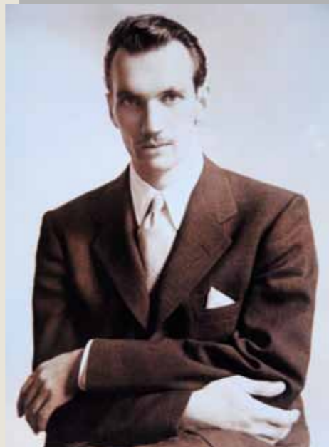
Jan Karski w pierwszych dniach wojny

Jesienią 1942 roku pod pseudonimem Jan Karski, którego odtąd będzie stale używał, wyruszył do Wielkiej Brytanii, skąd latem 1943 roku został wysłany do Stanów Zjednoczonych. Miał przedstawić aliantom raport o sytuacji Polskiego Państwa Podziemnego. Jednym z jego głównych zadań było także poinformowanie społeczności międzynarodowej o tragicznej sytuacji ludności żydowskiej pod okupacją niemiecką – zbierając informacje na ten temat, Karski przed wyjazdem dwukrotnie przedostał się do warszawskiego getta, a także do obozu przejściowego w Izbicy Lubelskiej. Wstrząsającą relację naocznego świadka przekazał amerykańskim i brytyjskim politykom, dziennikarzom i artystom. Spotkał się między innymi z ministrem spraw zagranicznych rządu brytyjskiego – Anthonyem Edenem oraz z prezydentem USA – Franklinem D. Rooseveltem. Jednak dramatyczne apele emisariusza o ratunek dla narodu żydowskiego nie przyniosły rezultatów – większość rozmówców nie dowierzała jego doniesieniom lub je ignorowała.