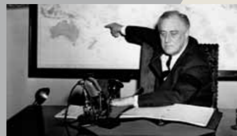
Prezydent USA – Franklin D. Roosevelt