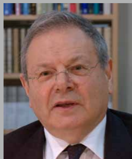
Sir. Martin Gilbert