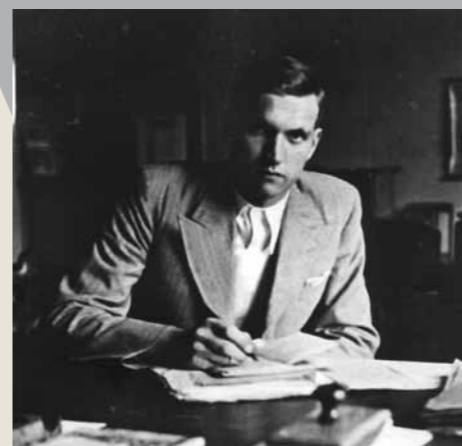
Warszawa, 1935. Karski w swoim gabinecie

Po wojnie Jan Karski zdecydował się pozostać na emigracji w Stanach Zjednoczonych. Podjął studia z zakresu nauk politycznych i obronił doktorat na Uniwersytecie Georgetown w Waszyngtonie, gdzie przez dalsze czterdzieści lat wykładał stosunki międzynarodowe i teorię komunizmu.