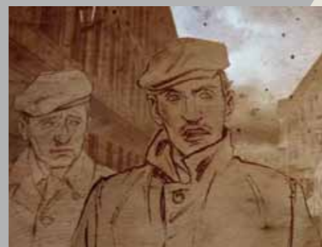
Jan Karski w getcie